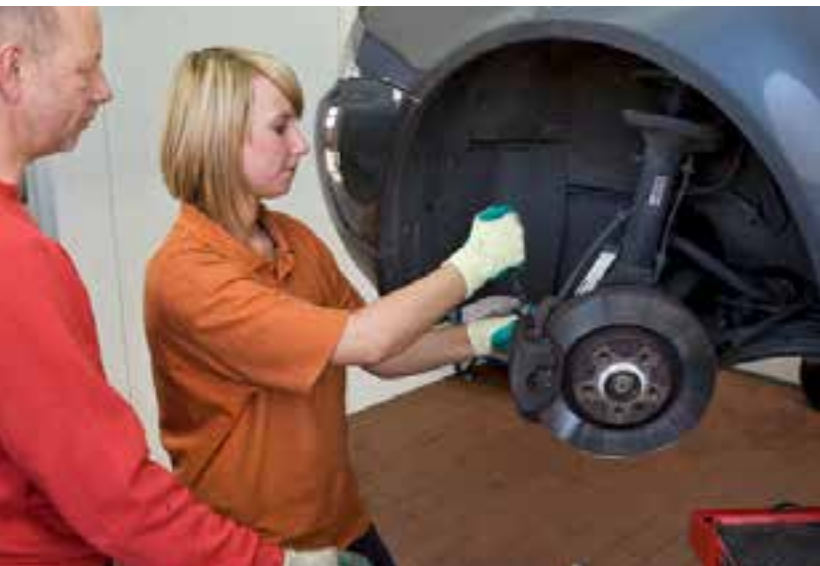
Seite 6 | Ausbildungsberuf Tankwart/-in