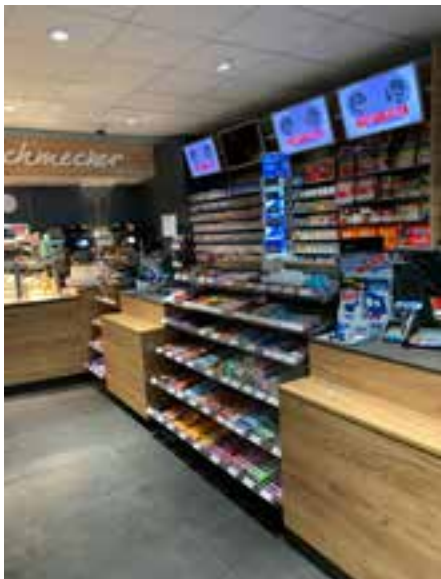
Beste Raumnutzung in der Kassenzone.