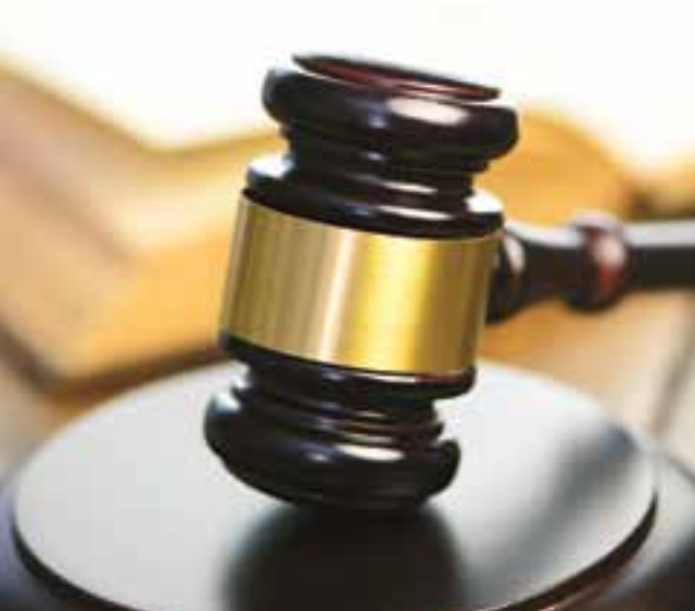
Seite 60 | Höhere Gewalt – Was hat das mit mir zu tun?