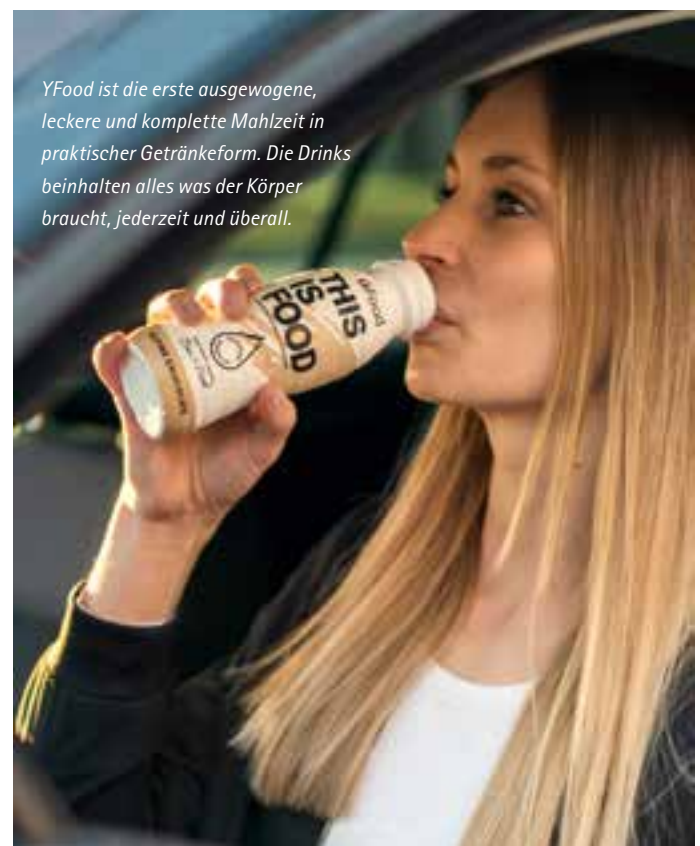
YFood ist die erste ausgewogene, leckere und komplette Mahlzeit in praktischer Getränkeform. Die Drinks beinhalten alles was der Körper braucht, jederzeit und überall.

Weitere Infos unter www.yfood.eu oder direkt an tankstelle@yfood.eu