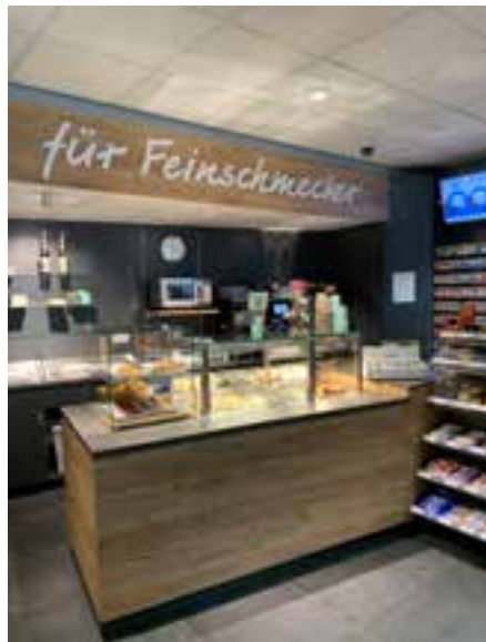
Frische Speisen aus der angrenzenden Gastronomie.