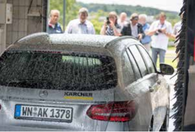
Die moderne Autowäsche muss vielen Ansprüchen genügen: kritische Kunden, außergewöhnliche Fahrzeugkonturen, Zeit und Geld.