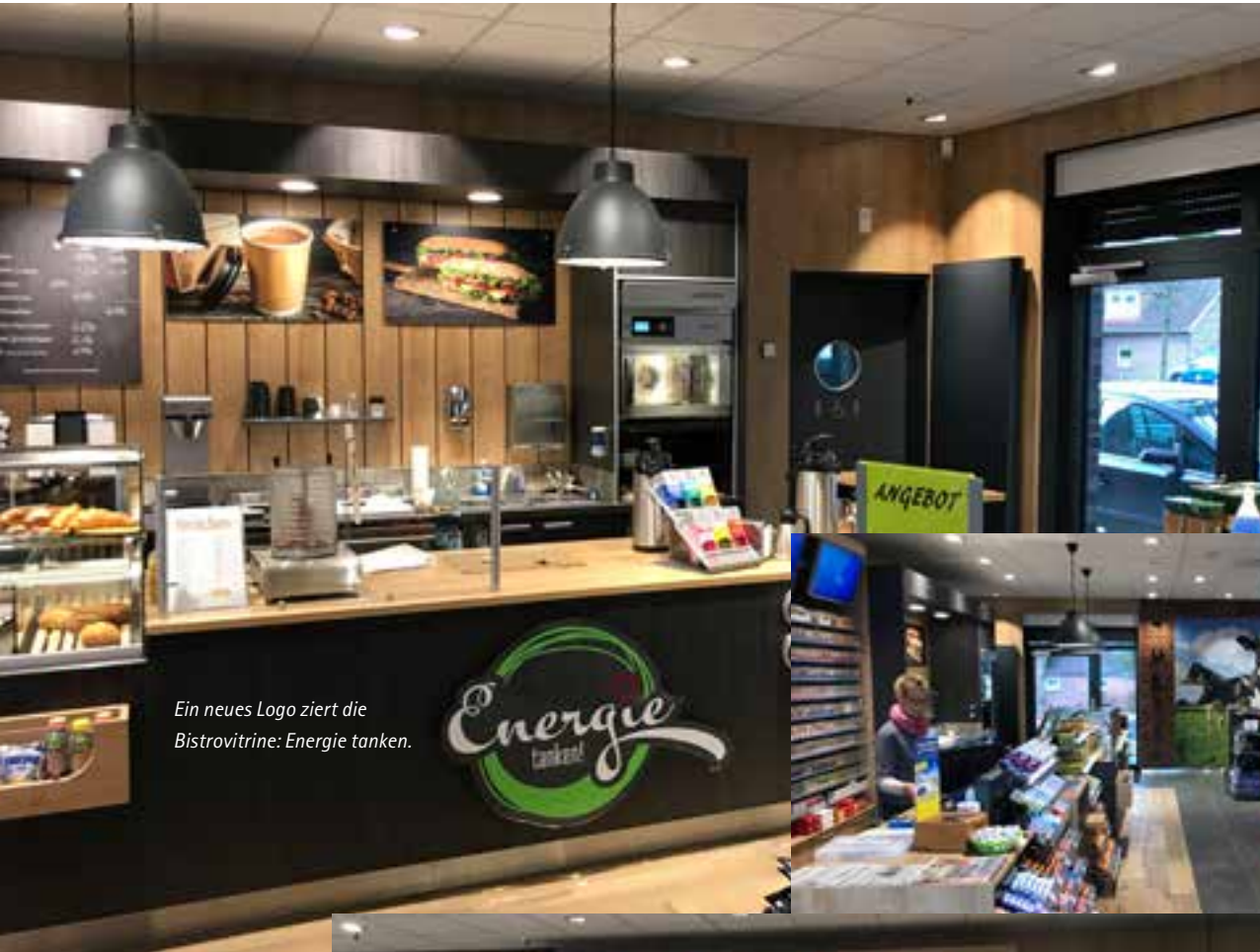
Ein neues Logo ziert die Bistrovitrine: Energie tanken.