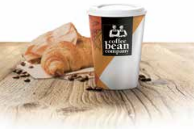
Seite 28 | Cool verpackt und fair produziert