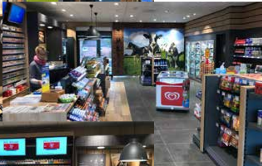
Optisches Highlight mit regionalem Bezug ist das Wandbild mit beinahe lebensgroßen Kühen.