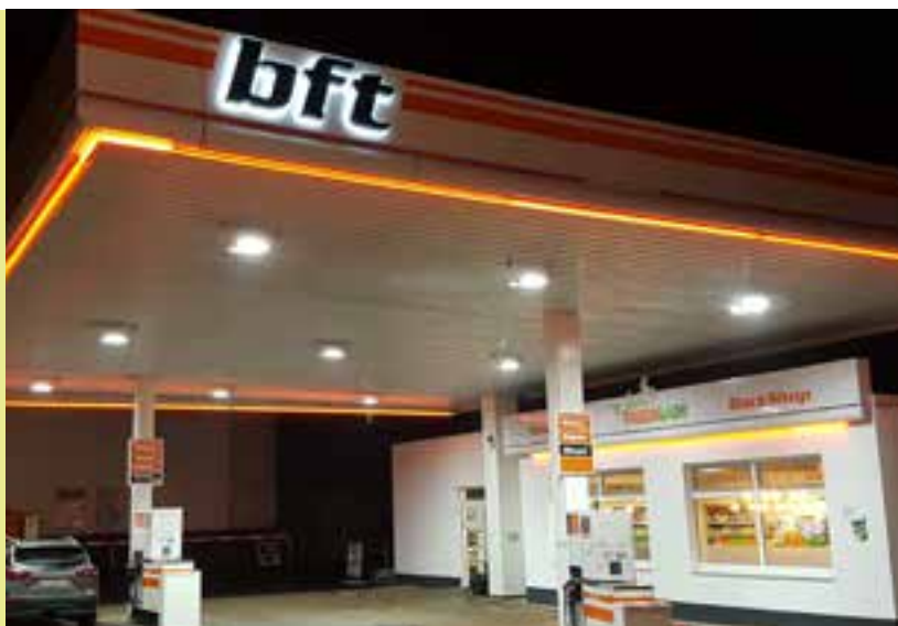
Seite 50 | Raiffeisen: Total umgerüstet auf bft-Tankstelle