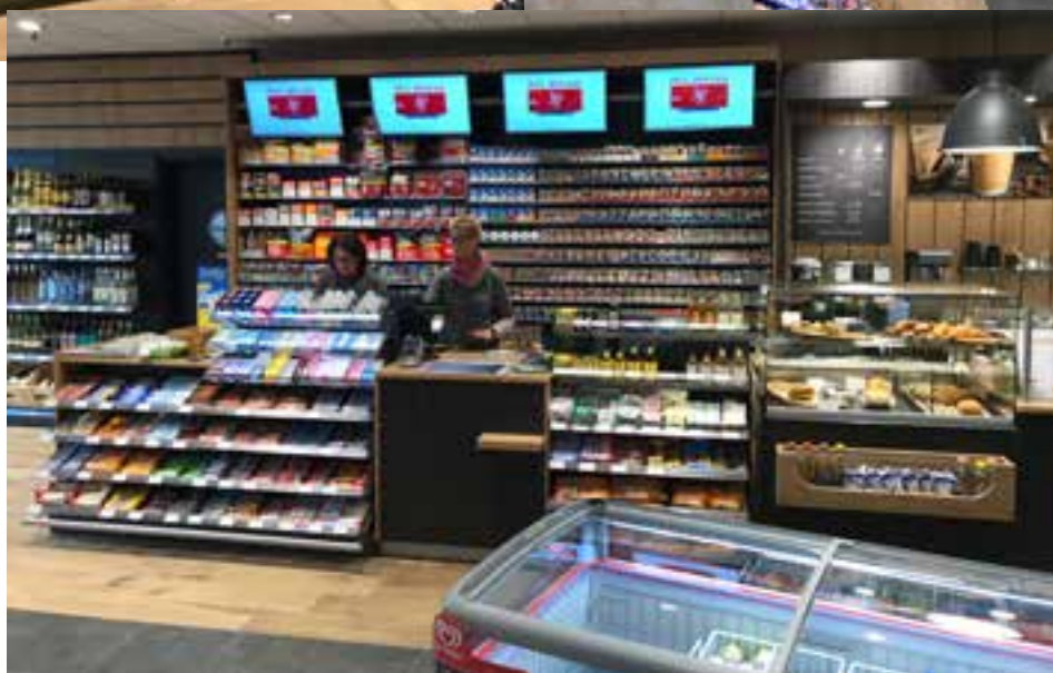
Die moderne Kassenzone mit einem kundenfreundlichen Zahlturn.