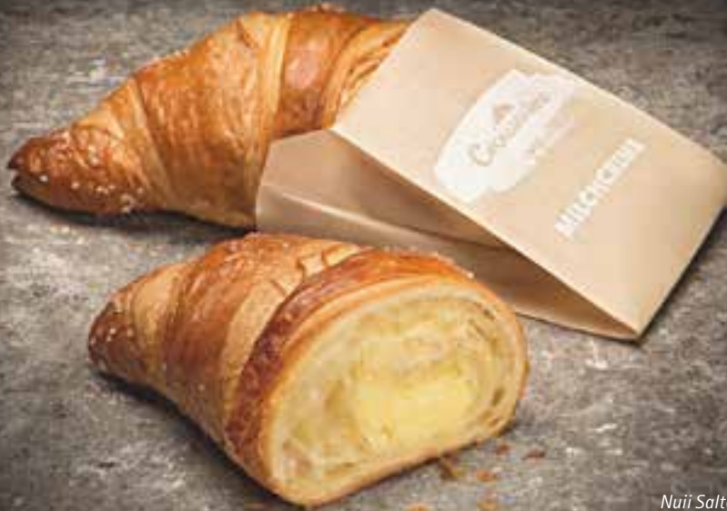
Nuü Salted Hazelnut & Tanzanian Coffee, Milchcreme-Buttercroissant