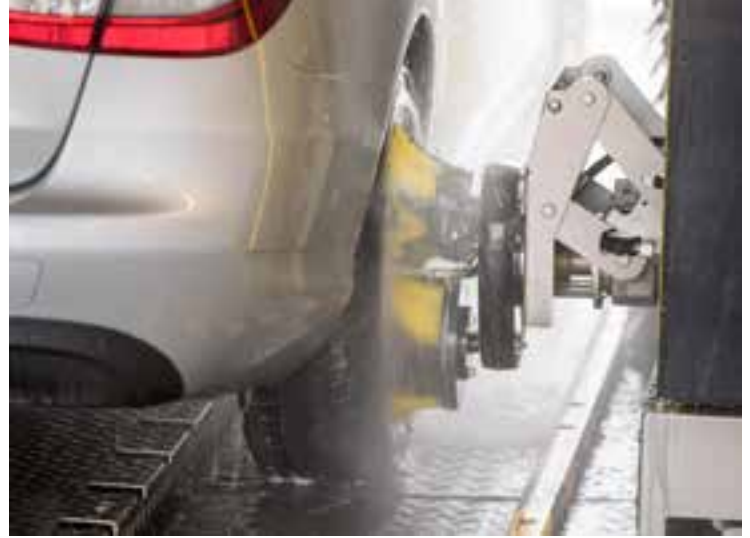
Das Reinigungsergebnis von Felgen hat an Bedeutung für den Kunden extrem zugenommen.